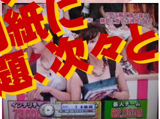
2008年9月5日(金) フジテレビ 「一攫千金 日本ルー列島」