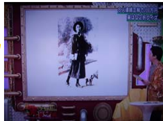
2008年10月1日(水) ABC朝日放送「ナイト in ナイト」