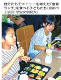
食育メニュー一試食発表会