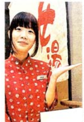
銭湯のフロントで外国人観光客の接客をする学生たち(上京区)