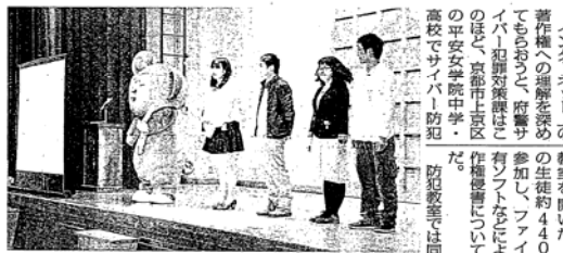
サイバー防犯教室で、ファイル共有ソフトの危険について寸劇を披露したロックモンスのメンバー(京都府上京区)

インターネットの著作権の理解を深め、著作権の生徒約440人が参加し、著作権の侵害を防ぐための授業が行われた。著作権の侵害を防ぐための授業が行われた。