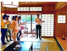
旅館関係者の説明を受けながら見学する学生たち(宇治市・花やしきリゾート)